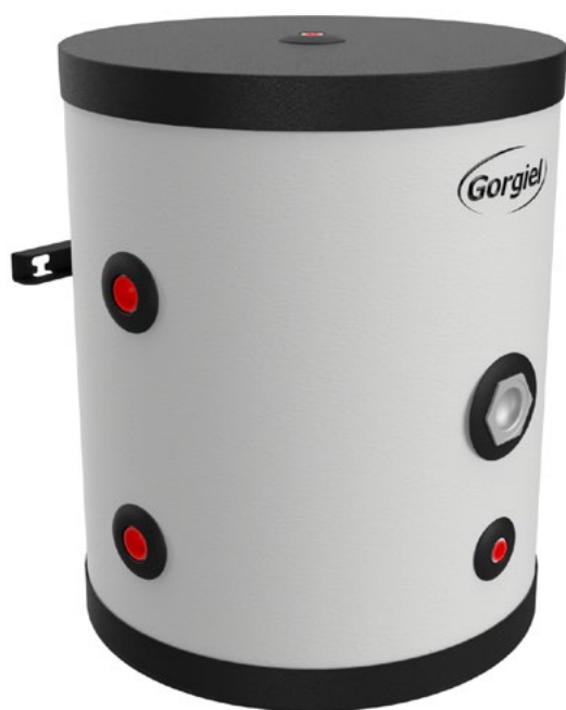
ZBG 60 G